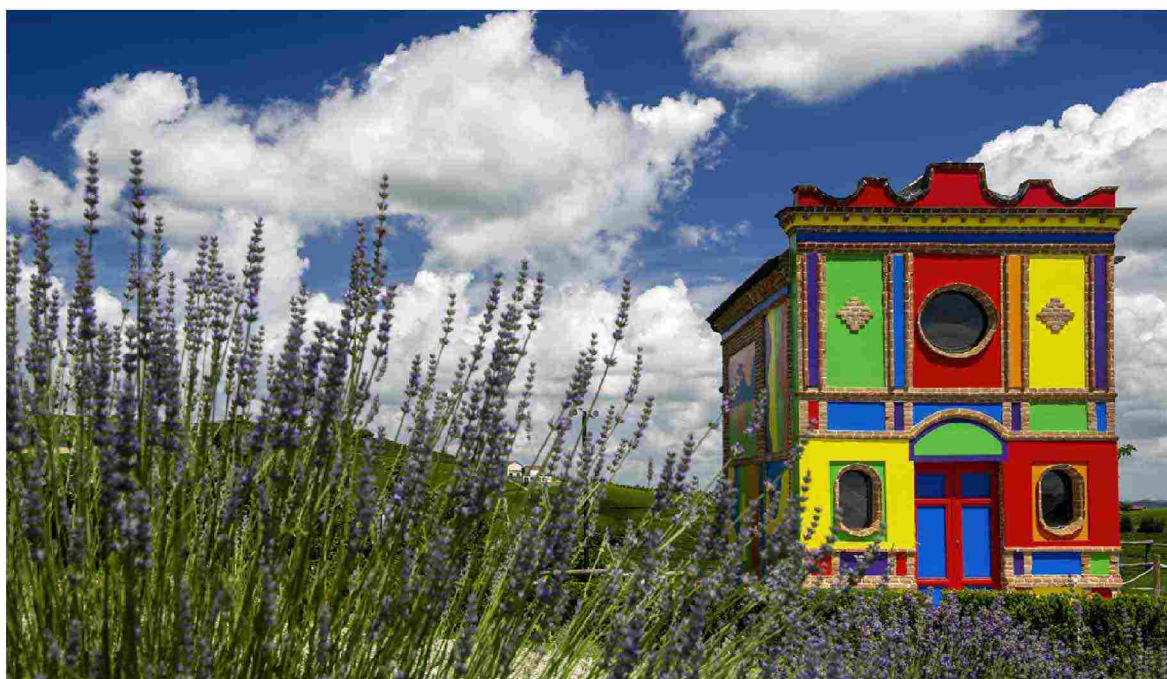
Sal LeWitt, Cappella Del Barolo, 1999. Opera installata presso Ceretto, Barolo, CN

Il progetto culturale della famiglia Planeta si estende invece oltre la produzione vitivinicola: residenze artistiche, collaborazioni