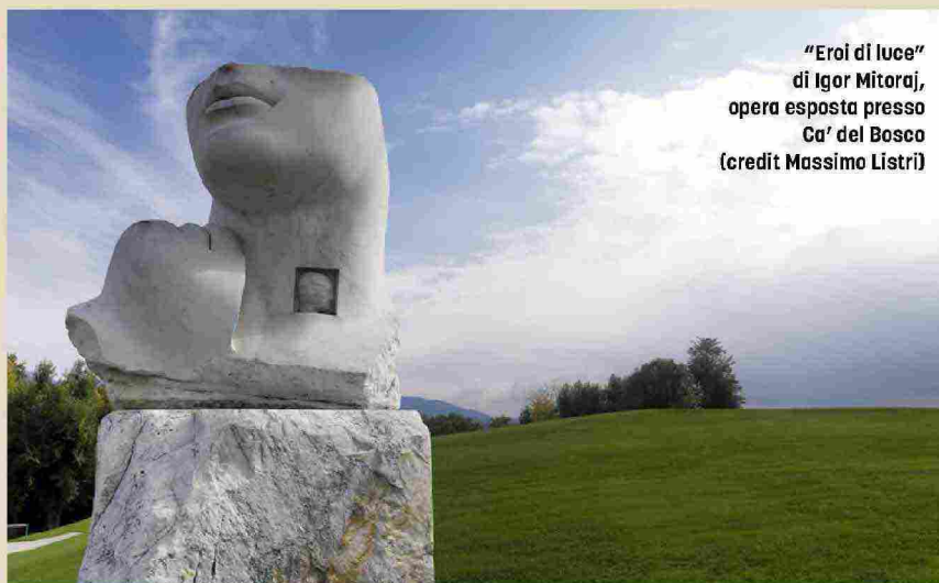
"Eroi di luce" di Igor Mitoraj, opera esposta presso Ca' del Bosco (credit Massimo Listri)