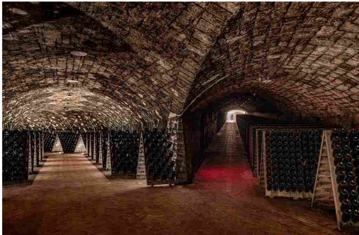
La galleria delle pupitres.

L'apice di un percorso di espansione e di simbiosi con il territorio circostante che trova espressione nel completamento delle strutture della cantina che custodisce spazi multisensoriali: i nuovi ambienti per l'accoglienza, il tunnel con i caveaux delle riserve di Franciacorta e nella cupola storica quelli dedicati alle cuvée Annamaria Clementi, la galleria delle pupitres (le tradizionali tavole con fori dove vengono inserite le bottiglie) e il tunnel riservato all'affinamento dei millesimati.