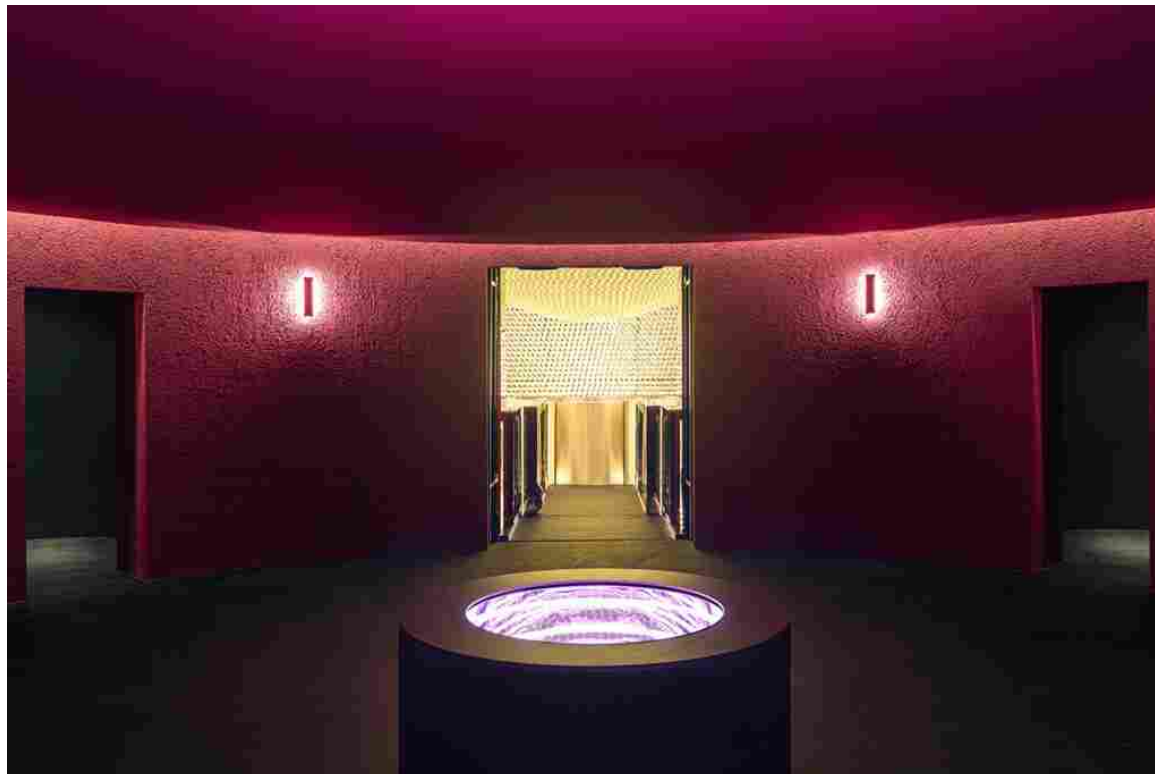
La cupola dei Sensi.

Al centro del percorso è posizionata la Cupola dei Sensi, uno spazio circolare con volta ribassata e scenografia dell'artista Andre Guidot del collettivo [[etica]estetica]anestetica . Tatto, olfatto, vista e udito vengono messi alla prova attraverso un'esperienza immersiva, emozionale e personale paragonabile a quella della degustazione dei vini.